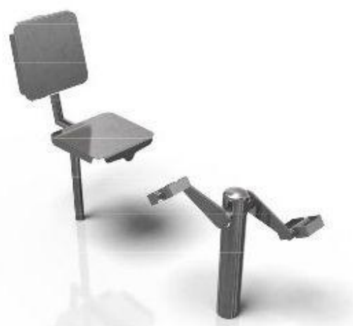
Vybavení nepoužívejte k jiným účelům. Práce na směry vyhrazeno.